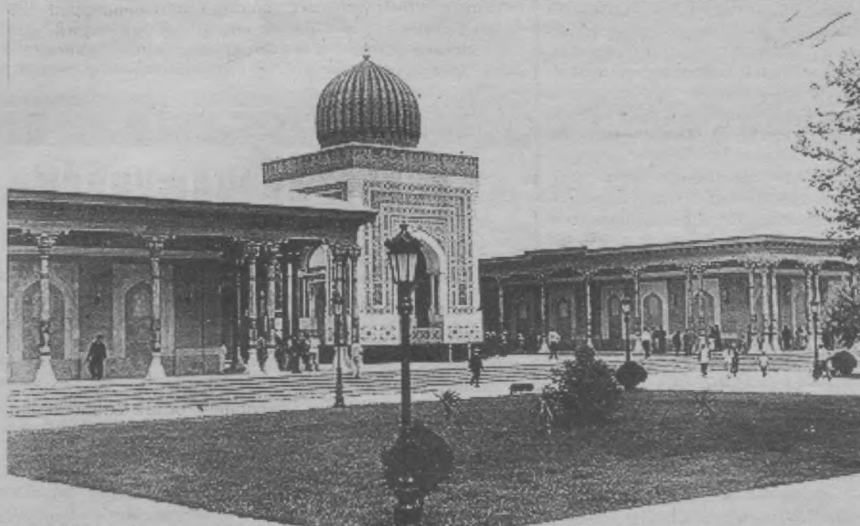
Суратда: Мустақиллик туғайли Имом ал-Бухорий зейратеги ана шундай табарруқ масканга айланди.

Бундай тавба-тазарру қилган шахсларнинг гуноҳидан ўтилди.