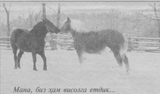
Мана, биз ҳам висолга етдик...