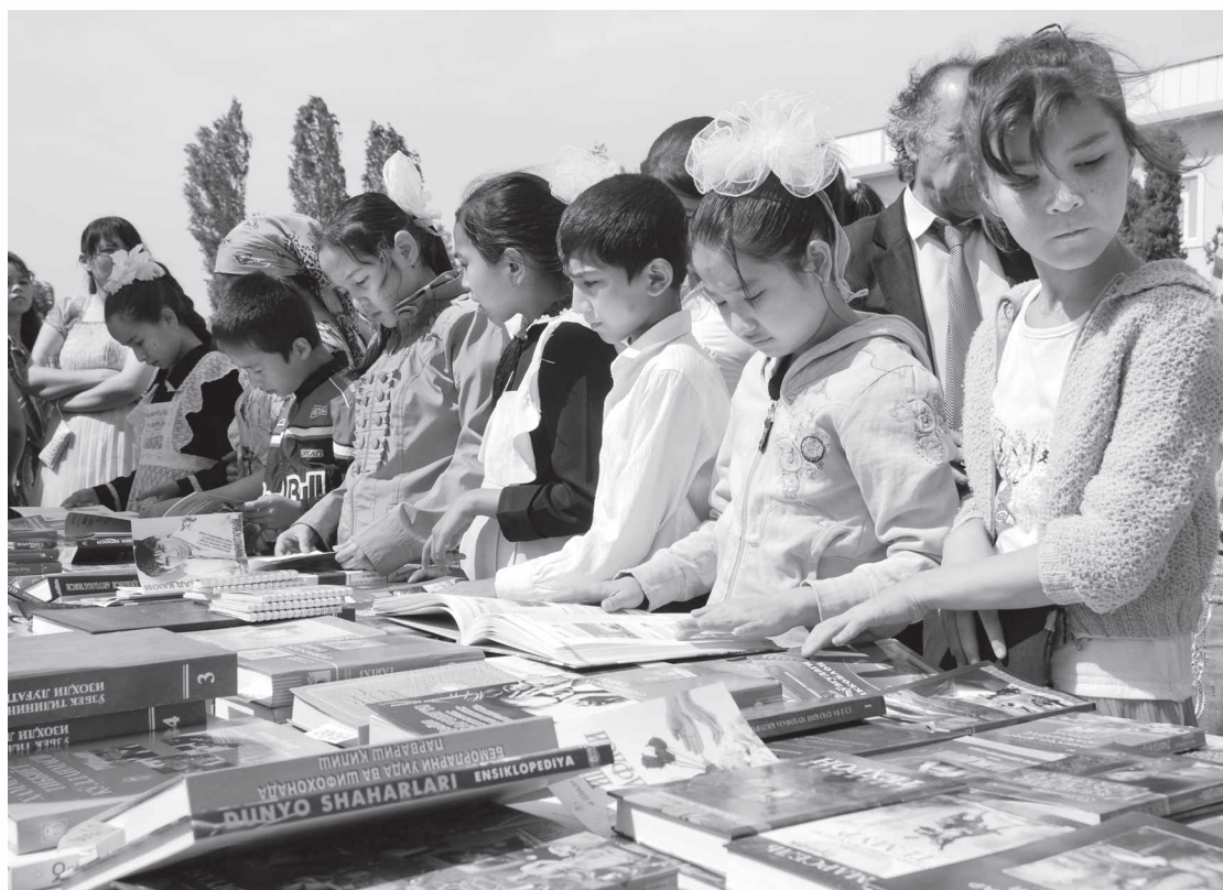
«Китоб байрами» муносабати билан ташкил этилган кўргазмада иштирокчиларнинг китобга бўлган меҳри яққол намоён бўлди.

— Ушбу фестиваль фақат китоб байрами бўлибгина қолмасдан, бадиий ижод бораси-