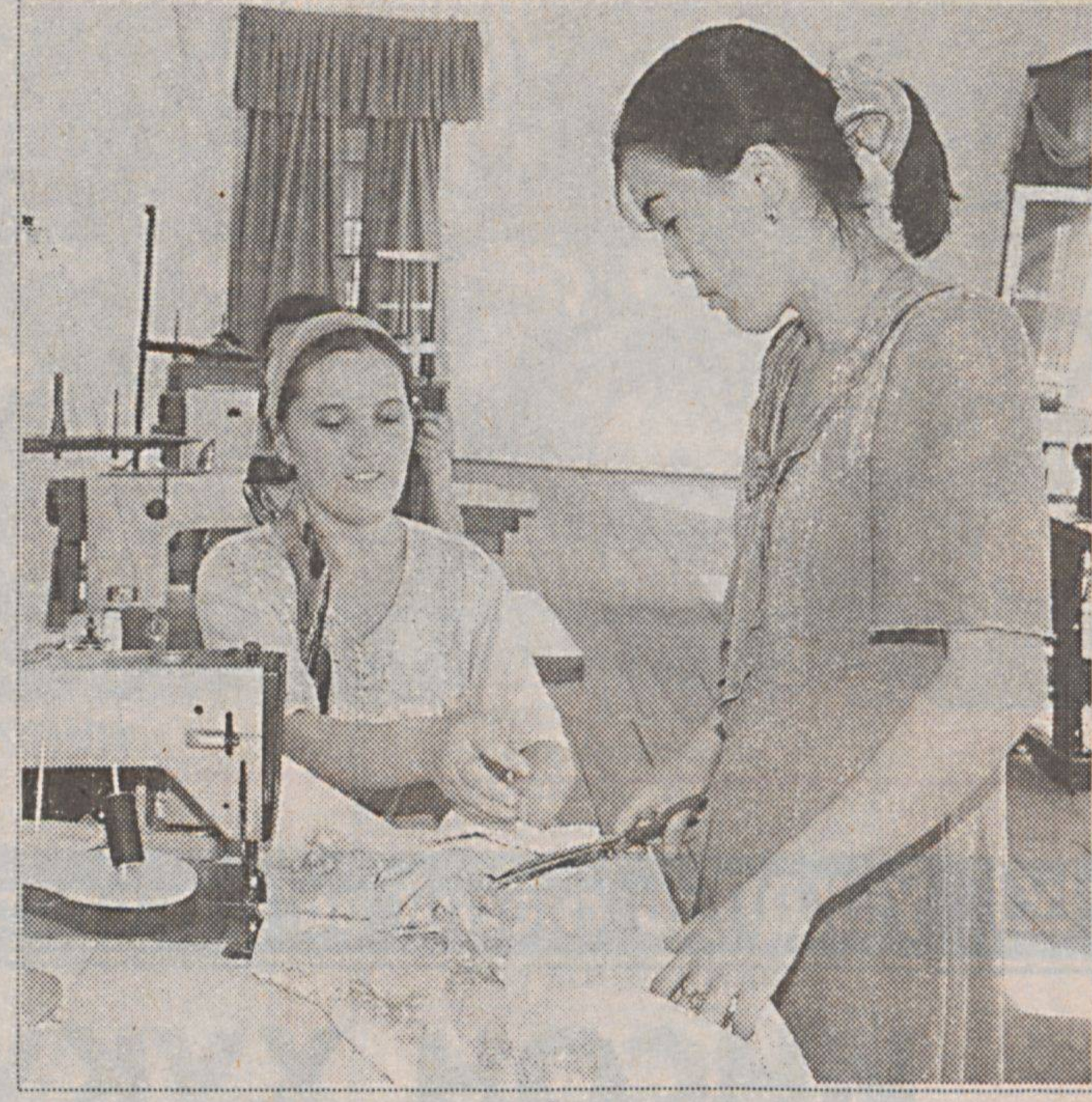
«РУХШОНА» ўқув марказининг «Матлуботсавдо» акциядорлик жамияти ҳузурда иш бошлаганиги Қува туманидаги ёшларни беҳад қувонтирди. Унда бугунги кунда 700 нафардан ортқ хотин-қиз ўзлари танлаган йўналишлари бўйича хунар урганмоқдалар. Айниқса, тикувчилик, пазандачилик, элита пардалари тикиш, дизайнлик — уйни безатиш ва компьютер саводдонлиги курсларига қизиқиш катта.

Шу жамият туман марказида қўллаб-қувватланадиган савдо хизмати кўрсатиш шохбачалари ташкил этиб, аҳолига замонавий сервис хизмати кўрсатмоқда.