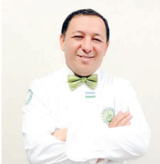
Саволларимизга Ўзбекистон ошпазлар уошмаси раиси Акбар Умаров жавоб қайтаради.

– Ўзбекистонда умумий овқатланиш корхоналари (УОК) ҳақида (бино, шариит, гигиена, хизмат кўрсатиш) ҳақида фикрингиз.