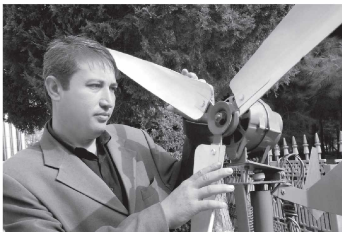
АҲОЛИ ФАРОВОНЛИГИГА ЯНА БИР ҲИССА

Шу ўринда қуёш энергиясининг имконияти ғоят улканлигини алоҳида қайд этиш жоиз. Қуёш ҳозирда башарият тасарруф этаётган қайта тикланмас энергиядан 10 000 мартадан кўп энергияни беришга қодир. Бу энергиянинг йиллик салоҳияти 50 миллиард 973 миллион тонналик нефть муқобилига тенг экани ҳақидаги илмий ҳулоса эътиборга олинса, республикамизда қуёшдан энергия олиш технологиясини амалиётга кенг татбиқ этиш ҳар томонлама афзал.