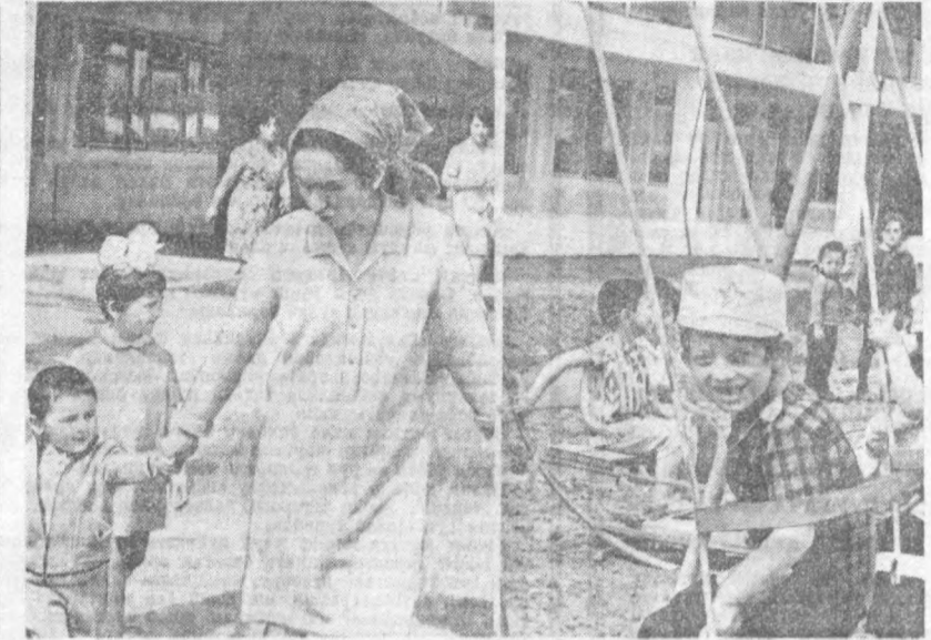
Ота-оналар меҳнат қиёғига етишганда уларнинг фарзандлари меҳрибон мураббийлар қўлида бўлади. Шаҳринидаги 140-болалар боғчисида ана шундай тарбиячилар бахтиёрликни ўз меҳр сураётлар: 1. Оналар боғчага ўз ўғил ва қизларини олиб келишмоқда. 2. Болалар майдонда қувноқлар аргимчоқ учинишати.