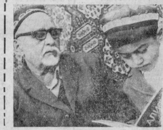
«Ўқи ўғлим, йўлнинг нурали бўлади». И. Шонпогомов фототўғи.

Бизда ҳамма ишлар ўз ўрнида бажарилиши керак. Ҳамма нарсанинг тоғишли ташкилотлари бор. Улар — ободлаштириш шаҳар ва район бошқармалари, ИЭКлар ва уй бошқармаларидан иборат. Ҳар бир метр ер, пивдалар қатнайдиган ҳар бир тротуар ҳисобда. Бундан ҳақида масъул ишчилар ҳамўрдин қилишлари керак. Амалда ҳам шундай бўлиши керак. Лекин, йўлнинг