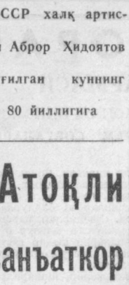
СССР халқ артисти Аббор Ҳидоятوف туғилган кунининг 80 йиллиғига

Аббор Ҳидоятов 1944 йилда «Масъум» асаридида Масъум образини яратган.