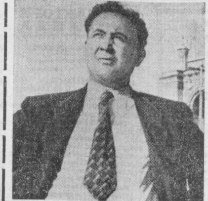
СССР халқ артисти Аббор Ҳидоятوف туғилган кунининг 80 йиллиғига