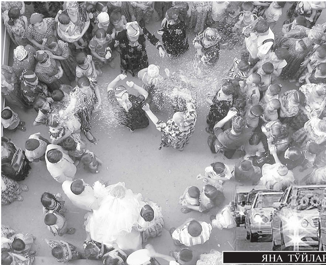
ЯНА ТҮЙЛАРИМИЗ ҲАҚИДА