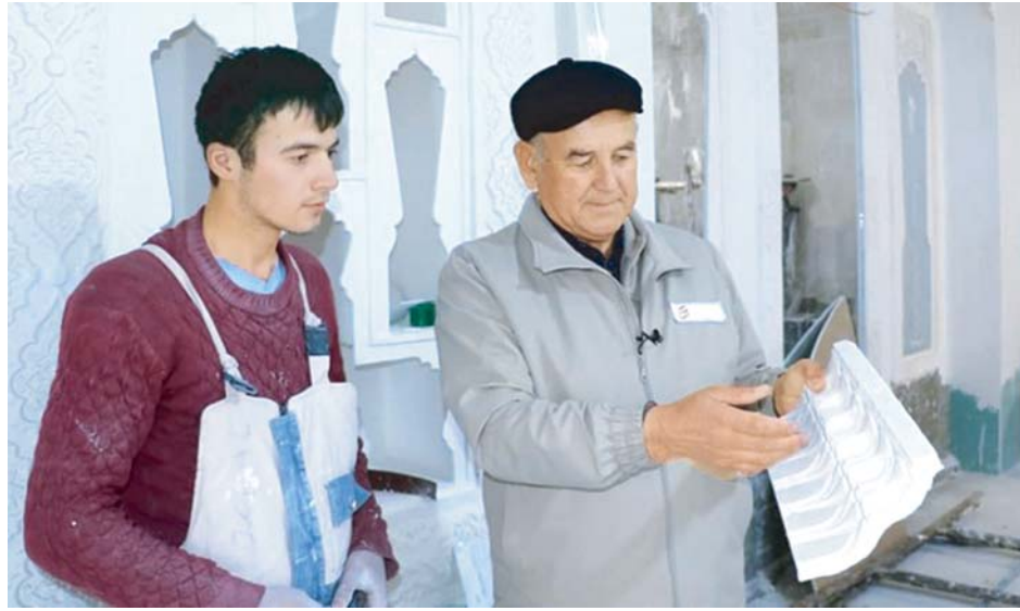
менных условий для приема многочисленных паломников.

Рядом с комплексом появятся гостиницы и гостевые дома, автоостанка, автостанция, пункты общественного питания, торговые ряды, помещения для омовения. Главе государства была представлена информация о ходе реализации масштабного проекта. Президент дал указания по качественному строительству объектов, созданию совре-