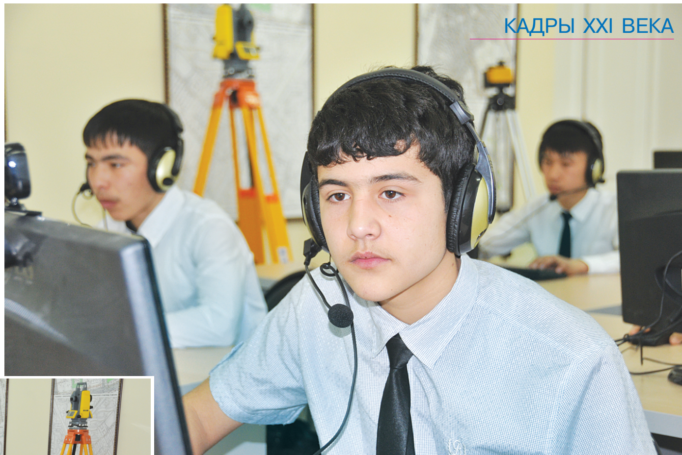
КАДРЫ XXI ВЕКА

Выступая на Международной конференции «Подготовка образованного и интеллектуально развитого поколения — как важнейшее условие устойчивого развития и модернизации страны», состоявшейся в нашей столице, глава государства подчеркнул, что в Узбекистане за последние годы проделана огромная по масштабам и глубине работа по кардинальному обновлению и реформированию сферы образования. В этом выступлении также отмечено, что принципиальная особенность реализуемой в республике модели заключается в том, что после девяти лет учебы в общеобразовательной школе следующие три года учащиеся обучаются в специализированных профессиональных колледжах и академических лицеях, где каждый из них наряду с общеобразовательными дисциплинами получает профессиональную подготовку по 2-3 востребованным на рынке труда специальностям.