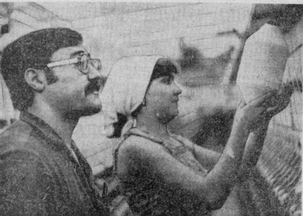
Сулаймоновнинг номини Тошкент тўқимачилик фабрикасининг илгирчи раҳбари...