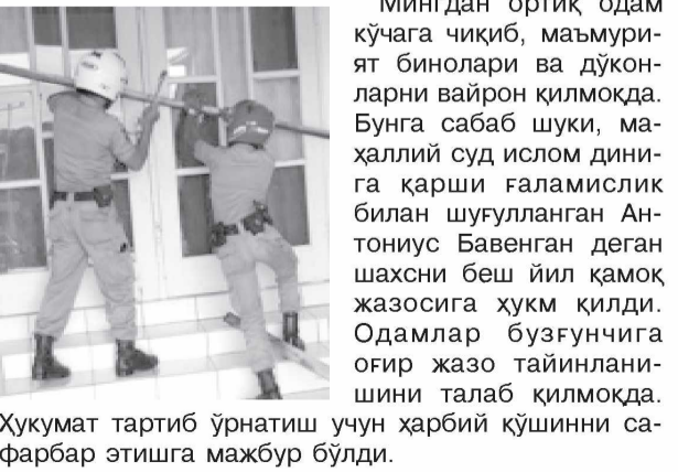
Хукумат тартиб ўрнатиш учун ҳарбий қўшинни сафарбар этишга мажбур бўлди.

Индонезиянинг Ява оролида оммавий тартибсизлик авж олди.