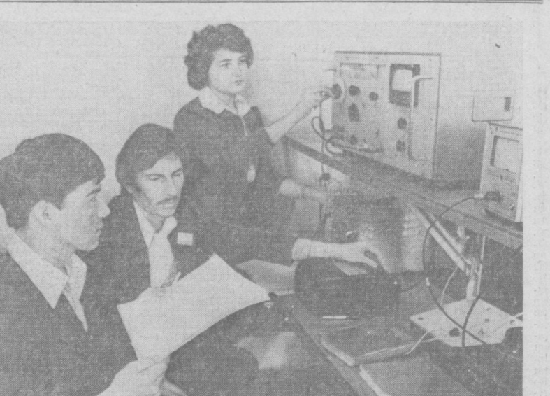
Тошкент электротехника алоқа институтининг намуналатимиз халқ хўжалиги учун кўлаб юкори малакали инженер кадрлари тайёрлаб бераётган йиринк ўкув марказидир.

Газетхон илтимоси Редакциямизга газетхонлардан келаятган хатлар орасида улар ўқ отадиган курулини сайлаш қондалари ҳақда уларни қайтадан рўйхатдан ўтказиш тўғрисида хикоя қилишни илтимос қилганлар. Биз бу ҳақда милиция капитани И. Раҳмоновдан хикоя қилиб беришни сўрадик.