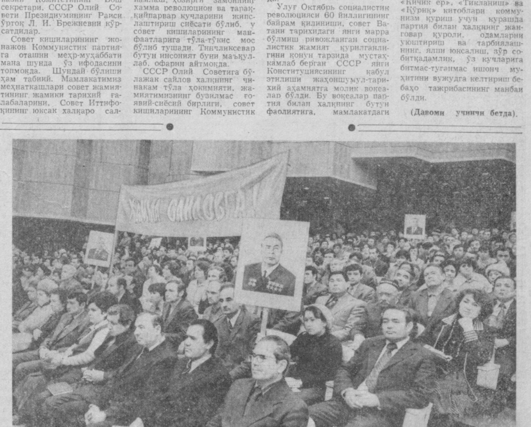
Суратда: Санъат саройи залда сайловчилар билан учрашув пайти.

Илмий байрами муносабати билан Москвага келган эди. Самимий, дўстона суҳбат бўлди. М. ПИП Марказий Комитетининг аъзоси, ЦКР ташқи ишлар министри Э. Вайтшек Совет ҳукуматининг ташқи алоқалар вазирлиги Биноси 5 февраль куни Москвага келди.