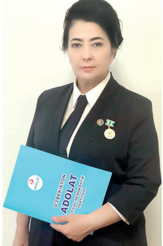
МУХИБА БАБАБЕКОВА, партиянинг Самарқанд вилоят кенгаши раиси