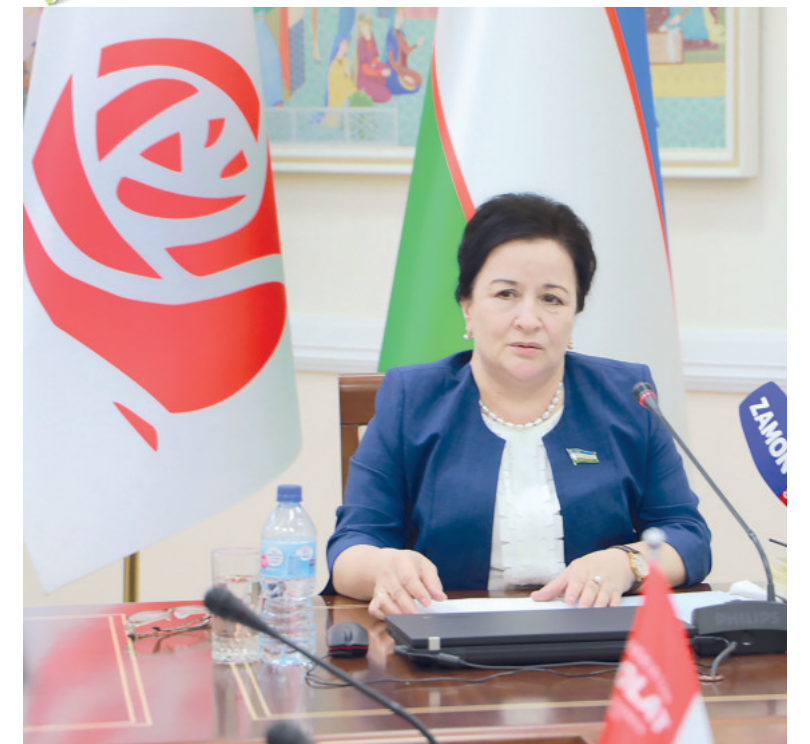
Зухра ИБРАГИМОВА, Олий Мажлис Қонунчилик палатаси Спикери ўринбосари

Янги йил байрами болажонларга ўзгача завқ бағишлайди. Безатилган арча ва тухфа этиладиган ажойиб совғалар уларнинг қувончига қувонч қўшади.