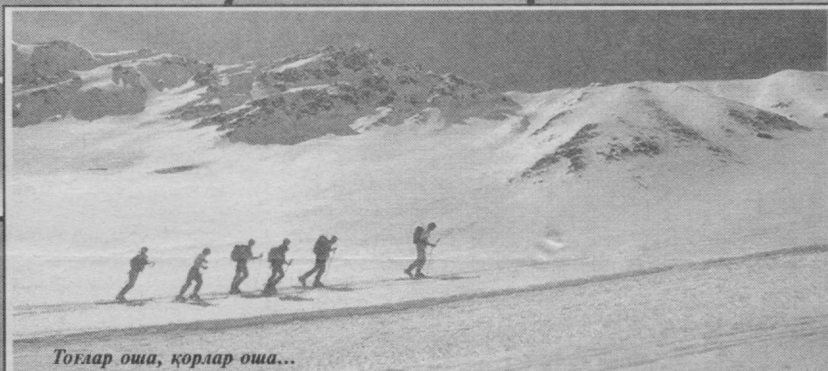
Тоғлар оша, қорлар оша...