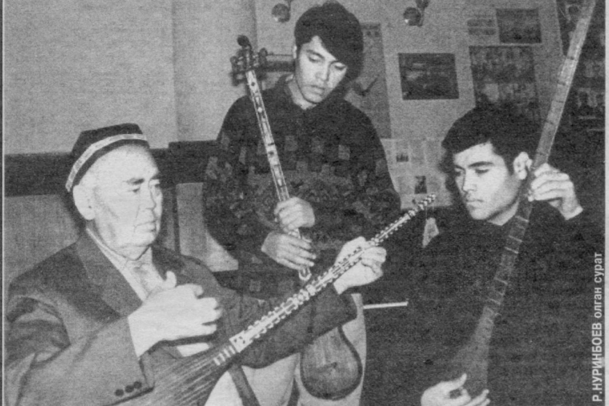
Машҳур санъаткор Турғун Алиматов номи ўзбекнинг ҳар бир хонадонига таниш. Миллий санъатимизнинг жонқури, машҳур созанда ўз ишининг давомчиларини тайёрлаш ишига ҳам катта эътибор қаратмоқда. Суратда: Турғун Алиматов шогирдлари билан.