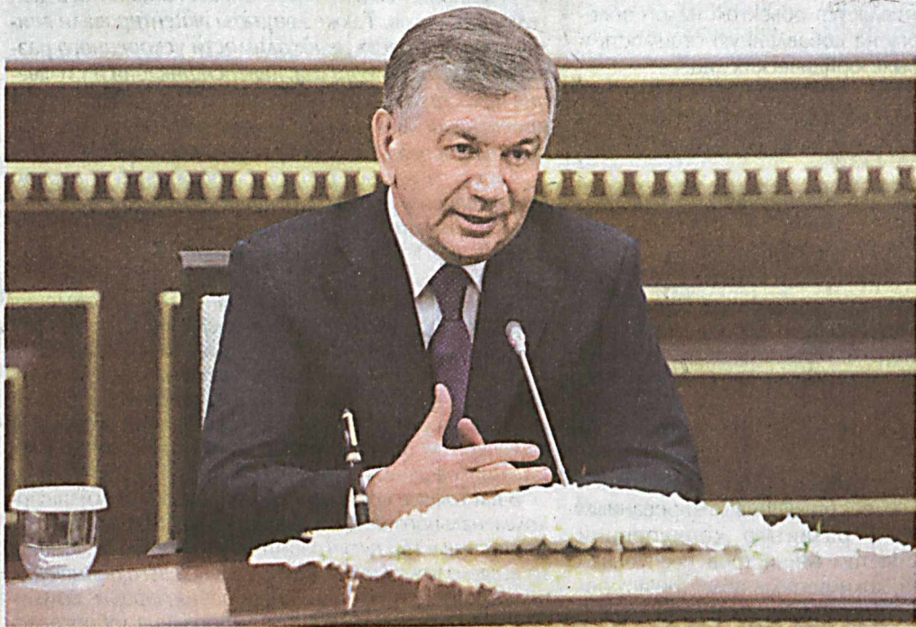
Президент Республики Узбекистан Шавкат Мирзиёев 6 марта принял министра финансов Российской Федерации Антона Силуанова, прибывшего в нашу страну с рабочим визитом для проведения двусторонних межведомственных консультаций.

Тепло приветствуя гостя, глава нашего государства особо подчеркнул, что регулярные встречи и контакты на высшем уровне, практическая реализация достигнутых по их итогам договоренностей и принятых соглашений способствуют последовательному укреплению двусторонних отношений стратегического партнерства и сотрудничества, а также расширению мно-