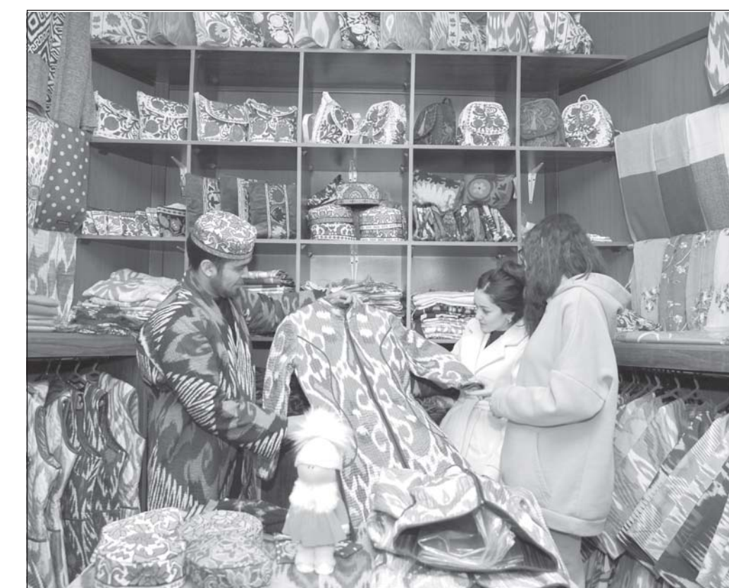
Дар кӯчаи «Сайлгоҳ»-и пойтахт тахти ҳамқорию иттиҳодияи «Хунарманд», ҳоқимияти шаҳри Тошқанд ва Палатаи савдою саноат дар мавзӯи «Broadway craft bazar Tashkent-2021» намоиш-савдои маҳсулоти хунармандӣ ташкил карда шуд.

Вай зуд вориди меҳмонхона шуду сими фурузонакҳо-ро ба хати барқ пайваст. Ин ҳангом фурузонакҳои сурху зард ва кабуду сабз дарги-