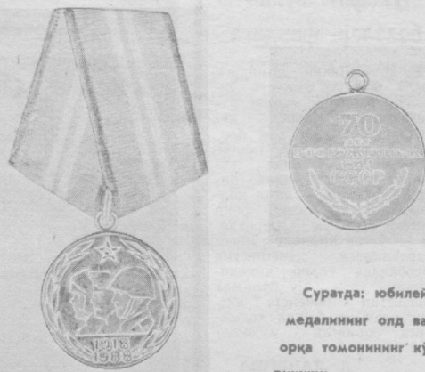
Суратда: юбилей медалининг олд ва орқа томонининг кўриниши.

СССР Олий Совети Президиумининг Секретари Т. МЕНТЕШАШВИЛИ.