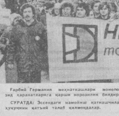
Гарбий Германия меҳнатқашлари монополияларнинг меҳнатқашлар ҳаётини манфаатларига эид ҳаракатларига қарши норозилик билдиришмоқдалар.