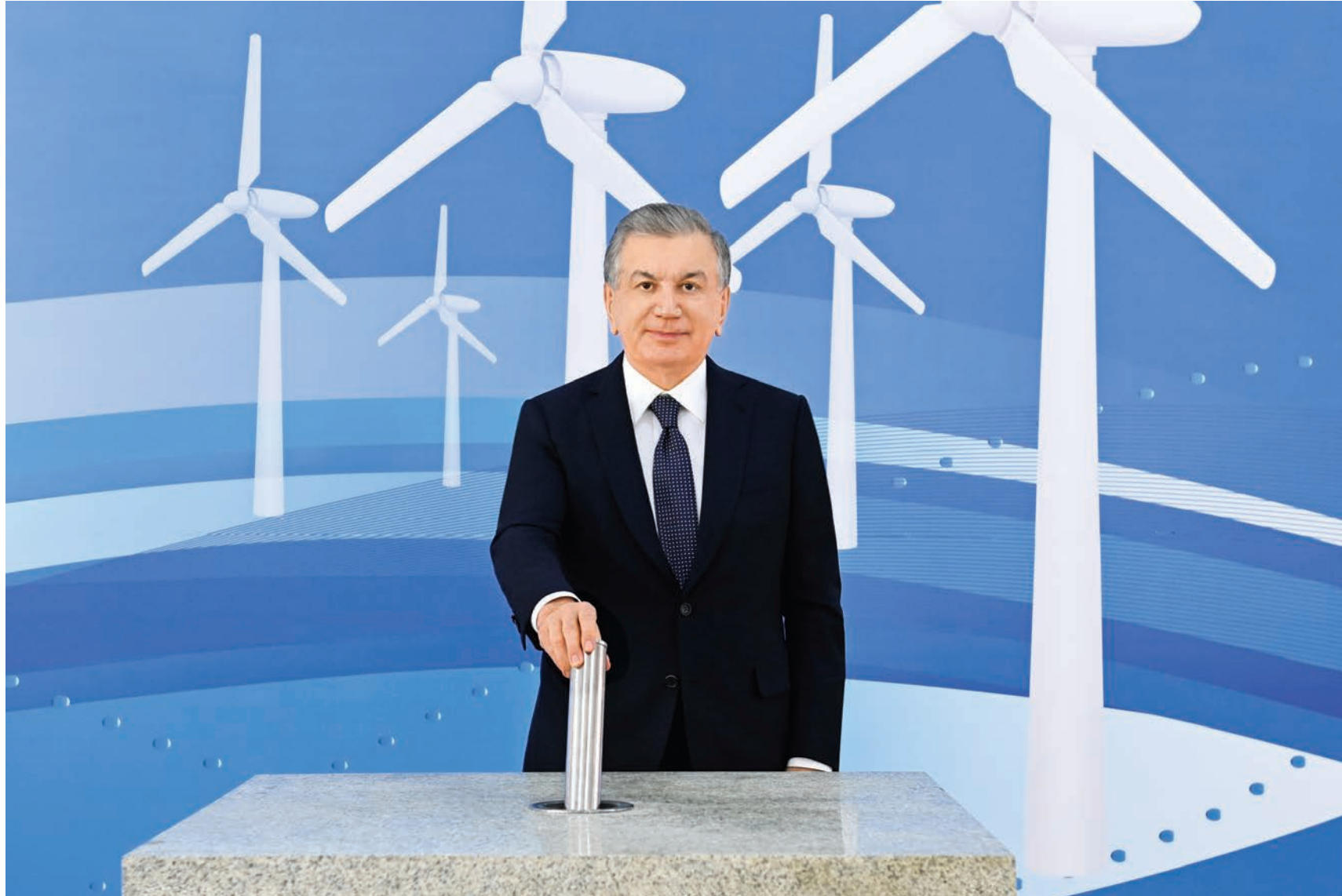
Президент Шавкат Мирзиёев для ознакомления с осуществляемой созидательной работой, крупными проектами на местах и жизнью населения посетил Республику Каракалпакстан.

24 февраля глава государства посетил Берунийский район. Здесь запланировано строительство ветряной электростанции в сотрудничестве с саудовской компанией ACWA Power. В связи с этим состоялась церемония закладки первого камня этого комплекса.