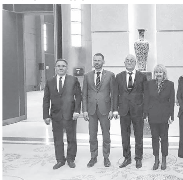
В завершение конференции ряд ее участников дал интервью ИА «Дунё».

Подчеркнута необходимость выполнения новыми властями Афганистана взятых на себя обязательств по созданию правительства на основе широкого представительства, соблюдению прав женщин и национальных меньшинств.