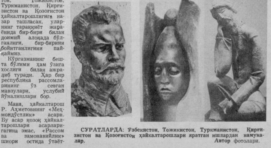
СУРАТЛАРДА: Ўзбекистон, Тожикистон, Туркманистон, Қирғизистон ва Қозоғистон ҳайкалтарошлари яратган ишлардан намуналар.

Биз, барча қари-ёш, эркак ва хотин Қасамд этганимиз, у каттик қасам: Ватану ватандош, дўстлар йўлида. Тайёримиз тикмоққа ҳатто жонин ҳам.