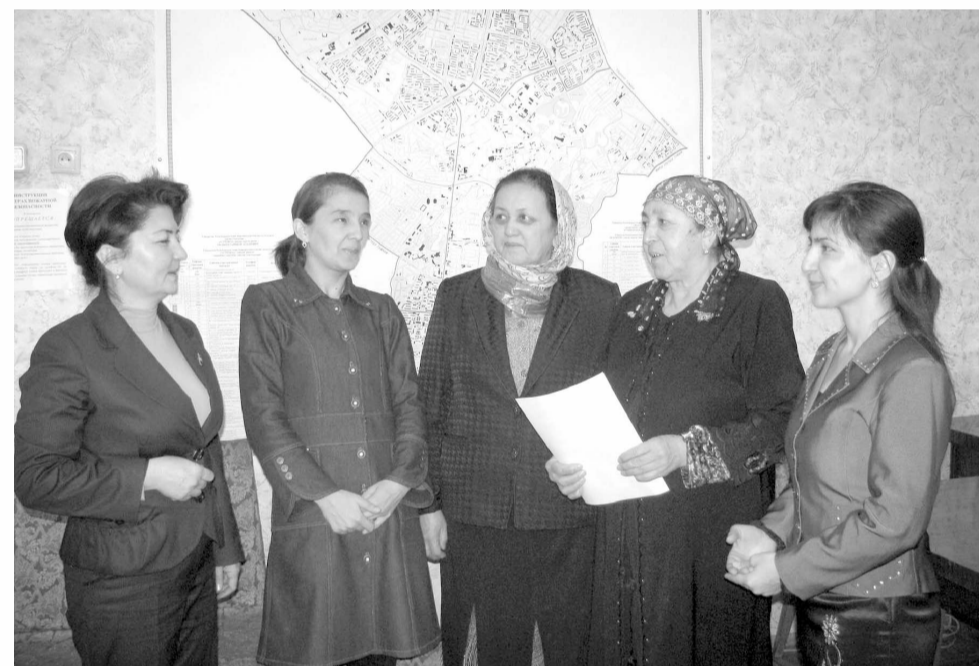
қабулхоналарида ҳам белгиланган тартибда фуқароларни қабул қилишди. Масалан, 2011 йил уларга 108 та мунозаат бўлди. Унинг 80 дан ортиги ижобий ҳал этилди. Муҳими, бу партиянинг электорат вакиллари орасидаги обрўини оширишга хизмат қилмоқда.

Муаммоларни бартараф этишда, айниқса, депутатлар ҳиссаси катта бўлаяпти. Шаҳар Кенгашига Юнусобод туманидан 3 нафар депутат сайланган. Улар ҳар ойда икки марта ўз худудиде аҳоли билан учрашиб, кишилар билан фикр алмашади, бирон-бир муаммо турилса, уни ечиш учун астойдил ҳаракат қилади. Бундан ташқари, Жамоатчилик