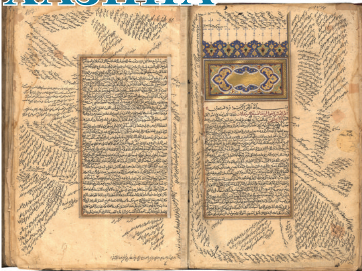
Ибн Сино, Тиб қонунлари

Мамлакатимизда қадимий ёзма манбаларни сақлаш, тадқиқ ва тарғиб қилиш тизимини янада такомиллаштиришга устувор йўналишлардан бири сифатида катта эътибор қаратиб келинмоқда. Жумладан, Президентимизнинг 2022 йил 10 февралдаги “Қадимий ёзма манбаларни сақлаш ва тадқиқ этиш тизимини такомиллаштиришга доир қўшимча чора-тадбирлар тўғрисида”ги қарори бу борада муҳим қадам бўлди.