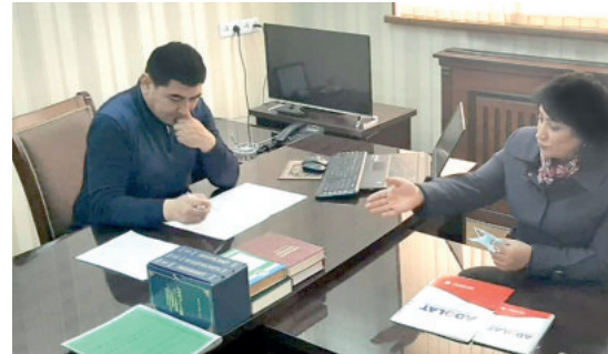
Мавлуда АДХАМЖОНОВА, Олий Мажлис Қонунчилик палатаси депутати:

Поликлиника 2021 йилда қайта ташкил этилиши режалаштирилган. Бироқ бино ҳамон таъмирталаб. Табиий газ, электр энергияси ва сув масаласи муаммо. Бу тиббиёт ходимларининг талаб даражасида ишлашига имкон бермайди.