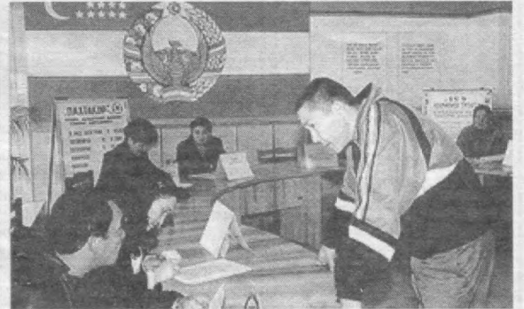
Шайхонтоҳур туманида меҳнат ярмаркаси.