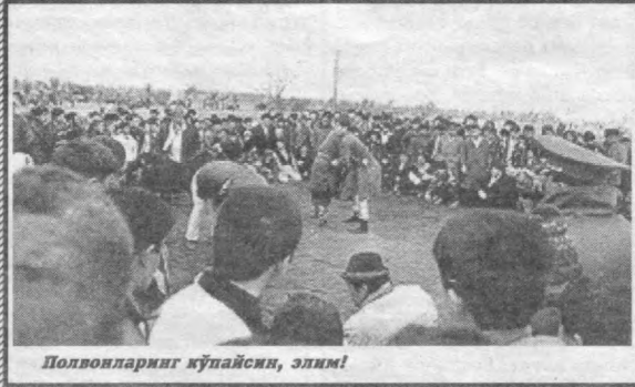
Полковларнинг кўпайси, элим!

37 КИШИГА 800 МИЛЛИОН Япон полицияси томонидан мамлакатдаги турли дўконлардан умумий қиймати 800 миллион йенлик товарларни ўғирлашда гумон қилиниб, 37 киши ҳибсга олинган. Аниқланишича, машҳур «Ямагути - гуми» мафия синдикати аъзоси Фуитсугу Морисаки мазкур кишилар ҳисобига янги жиноий гуруҳ ташкил этмоқчи бўлган. Гуруҳ бошлиғи ва унинг ҳаммаслақларига айблов эълон қилинган. Гуруҳ биринчи марта Кобе шаҳридаги дўкон витриналарини синдириб, 17,7 миллион йенлик қимматбаҳо соат ва бошқа буюмларни ўмариб кетган эди. Морисакининг кўрсатмаларига кўра, гуруҳ аъзолари шундан сўнг мамлакатнинг турли вилоятларида 1100 га яқин ана шундай ўғирликларни содир этганлар. Ўғирланган буюмларни нархи псайтирилган дўконлар орқали сотишган. Энди ҳаммаси учун жавоб беришга тўғри келади.