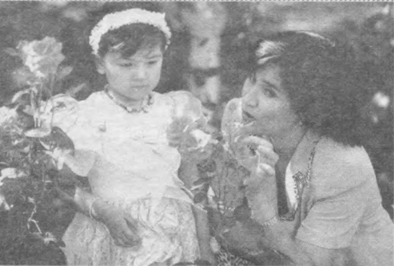
Келса гар Наврўзи олам, гаштин инсондан сўранг...