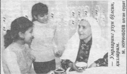
Умрларинг узун бўлсин, қизларим.

Моҳият Дунё манфаатдир (яъни дунёдаги ҳар бир нарсанинг бир нафи бордир) ва дунёнинг энг яхши манфаати (неъматини) яхшилик қиладиган ва солиҳа аёлдир. (Жадисдан)