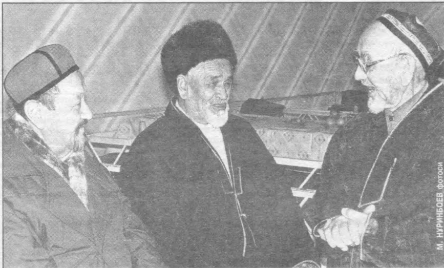
Қарияларимиз — қадриятларимиз