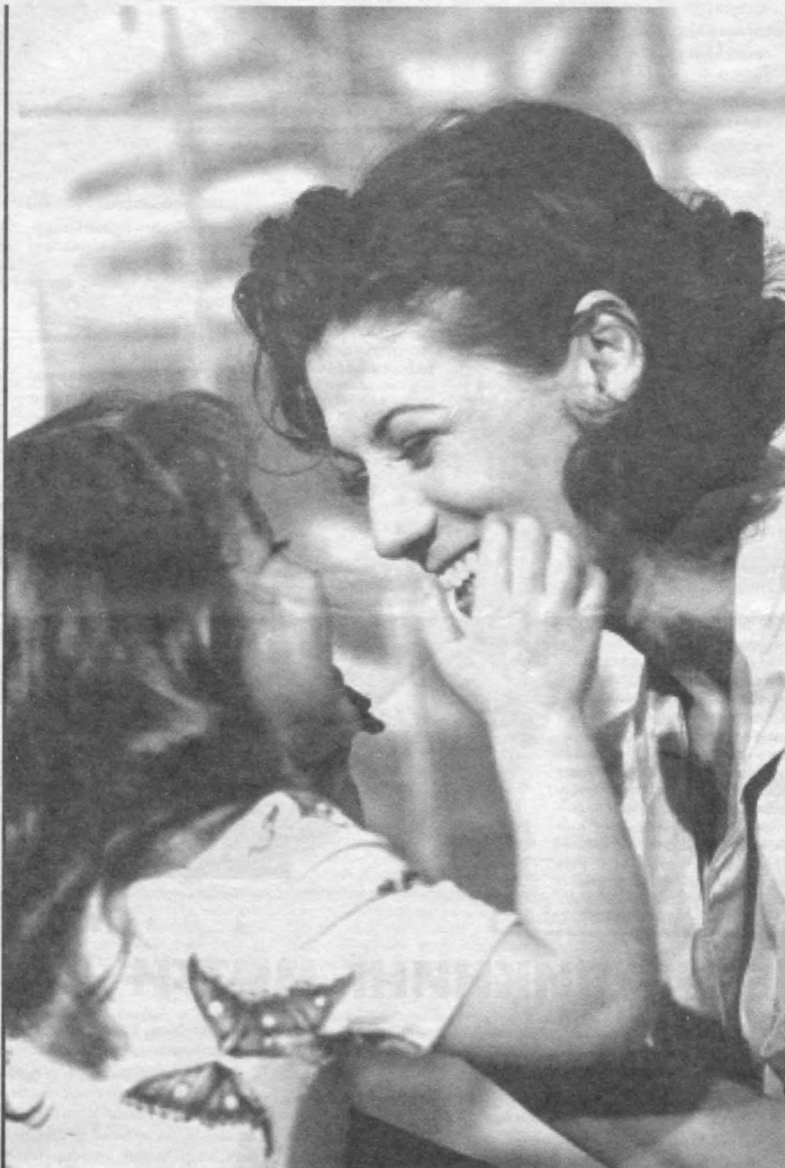
Она билан бола — гул билан лола

(Президент Ислоҳ Каримовнинг халқ депутатлари Навоий вилояти Кенгашининг навбатдан ташқари сессиясида сўзлаган нутқидан)