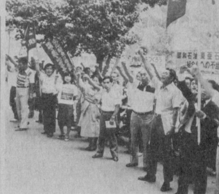
ЯПОНИЯ. Бу ерда «Оммавий ишдан бўшатил шисёсатига қарши норозилик билдириш», «Бизни иш билан таъминлашларини талаб қи-лаш» каби шорлар остида оммавий норозилик намойишлари ва забастовкалар бўлиб ўтмоқда. СУРАТДА: Токнодаги «Сёва сёки» нефть компанияси ходим-ларининг намойиши.

БЕРЛИН. ГДР жа-нубидаги Карл Маркс — Штадтидаги «Баум-волле» комбинати йи-гирув фабрикасида 8 та ил ўраш автомати электрон қурилма на-зорати остида кечаю-кундуз ишлаб туриб-ди. Бу янгилик 1984 йилда ўтган йилга нисбатан 125 тонна кўп юқори сифатли калава ил ишлаб чи-қариш имконини бера-ди. Ҳаммаси бўлиб 70