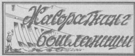
«АНДИЖОН ДЕНГИЗИ» РОМАНИДАН ПАРЧА

Хамид ҒУЛОМ, Ўзбекистон ССР халқ ёзувчиси, СССР Давлат мукофоти лауреати.