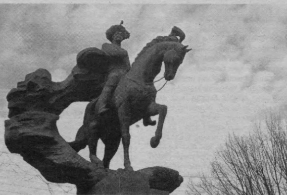
Заҳриддин Муҳаммад Бобур андижонликлар ифтихори