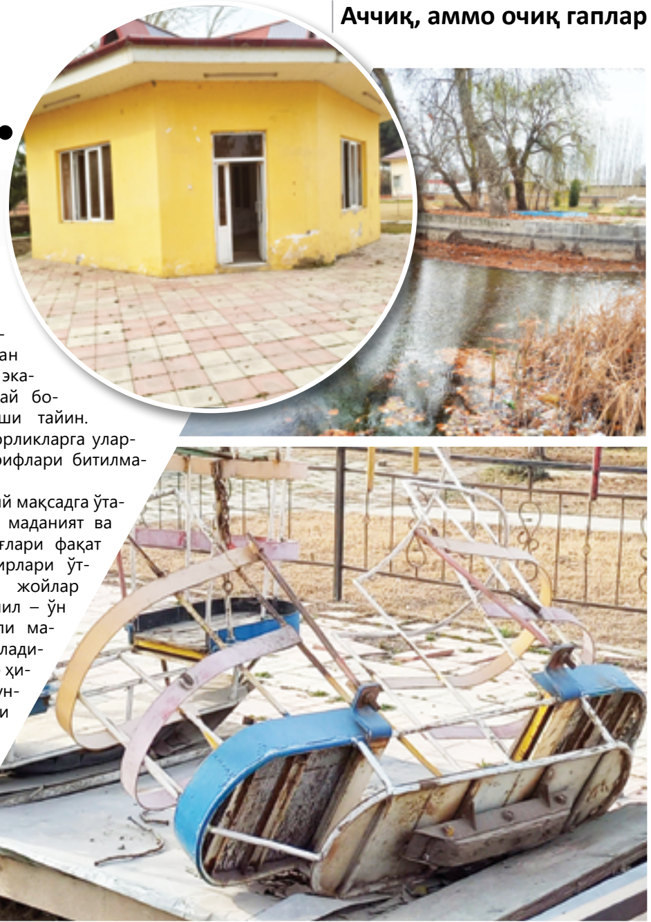
Аччиқ, аммо очиқ гаплар

Энди асосий мақсадга ўтadиган бўлсак, маданият ва истироҳат боғлари фақат байрам тadbирлари ўтказиладиган жойлар эмас, балки йил – ўн икки ой аҳоли мароқли дам оладиган масканлар ҳисобланади. Бундай бўлиши учун эса унда турли ёшдаги кишиларни ўзига жалбата –