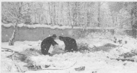
Мингбулоқ туманидаги 3-мактабга берилган 15 тонна кўмир шу ерда сақланган.