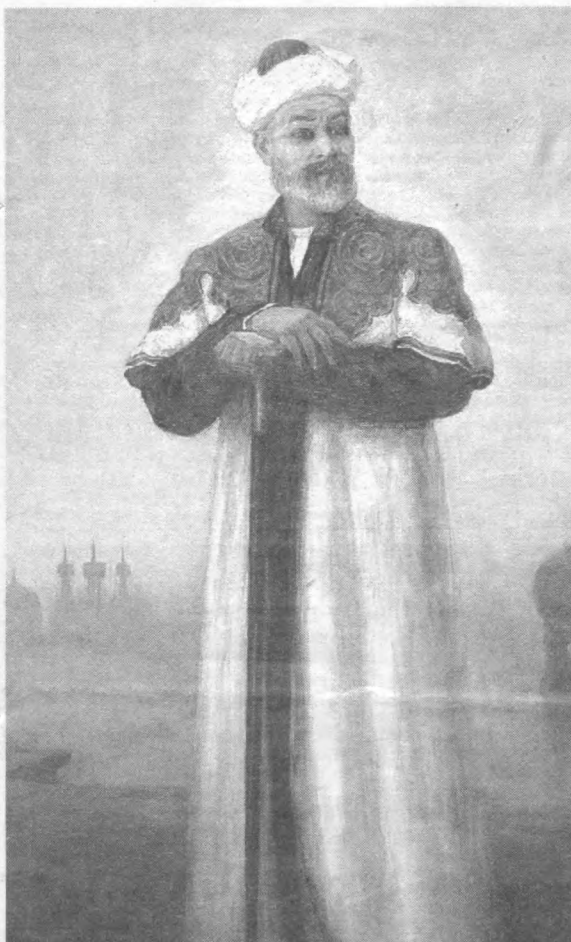
Эртага Алишер Навоий тававаллудига 565 йил тўлади

Ўзбекистон Республикаси Бош прокуратураси матбуот маркази