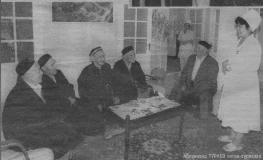
Абдувоҳид ТУРАЕВ олган суратлар