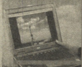
Интернет хабарлари асосида тайёрланди

Япония компанияларининг бирида ишлаб чиқарилган янги нусхадаги бу совуткич компю-тер билан жиҳозланган бўлиб, Интернетга улашни имконияти мавжуд. Унинг қулайлиги шун-даки, ишхонада туриб ҳам со-вуткичда нималар борлиги ва қандай махсулотларни харид қилиш лозимлигини аниқлаш мумкин. Бундай совуткичда сақ-ланаётган махсулотларни ичка-рида ўрнатилган телекамера орқали кўриш мумкин бўлади.