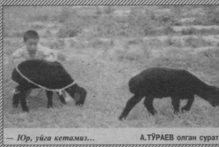
Юр, уйга кетамиз...