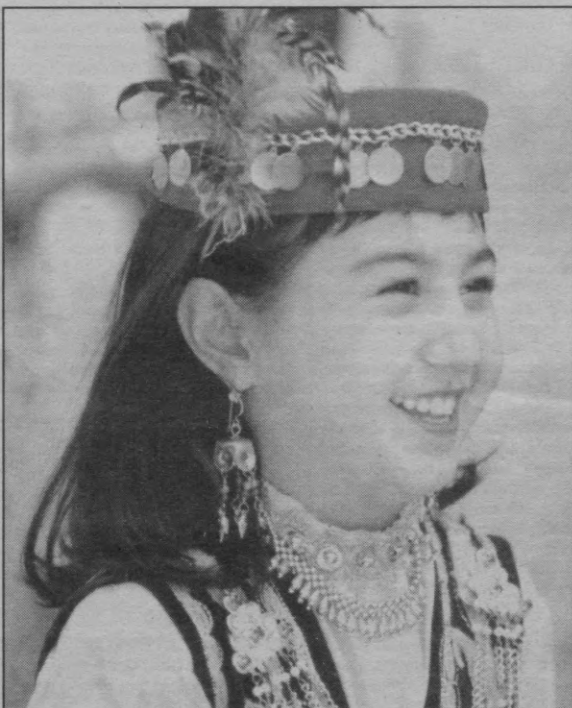
Кулгусида баҳор севинчи.

(Президент Ислам Каримовнинг Наврўз байрамга бағишланган тантанали маросимдаги табрик сўзидан)