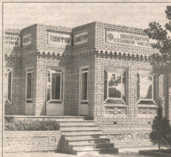
«Андижон Телеком» филиали Балиқчи телекоммуникациялар боғламасининг Чинобод қишлоғидаги «Бургут» сўзлашув маскани.

У. АШУРОВ, “Сурхондарё Телеком” филиали директори