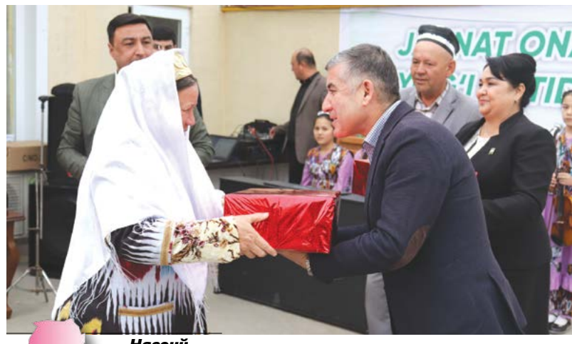
Навоий вилояти Танишув