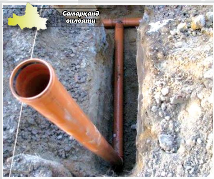
Уй-жой коммунал хизмат кўрсатиш вазирлигига!