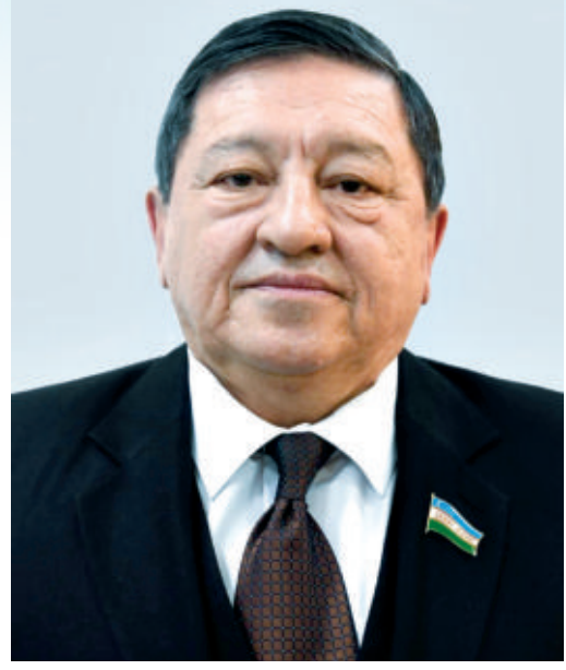
Рустам КАЛОНОВ, Тошкент шаҳар Нуронийлар кенгаши раиси, сенатор

кўнглини ўқитиб келган тизимга барҳам берилди. Яъни барча ишловчи пенсионерларга пенсияларни тўлиқ миқдорда тўлаш йўлга қўйилди. Бу ҳақда ҳали яна гап бор.