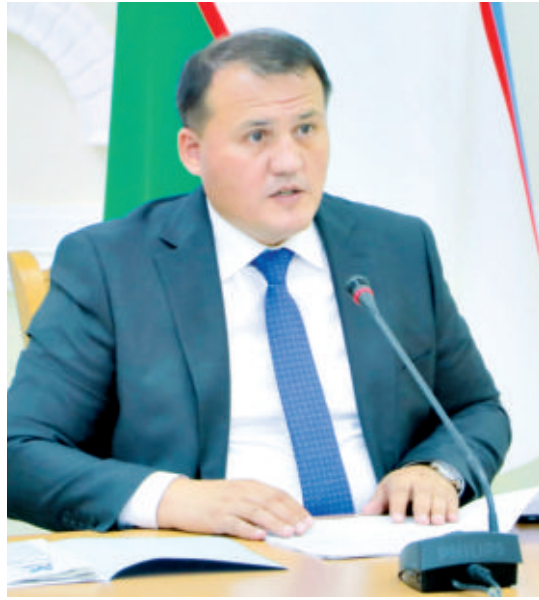
Ахмед ЗАЙТОВ, Олий Мажлис Қонунчилик палатаси Спикери ўринбосари