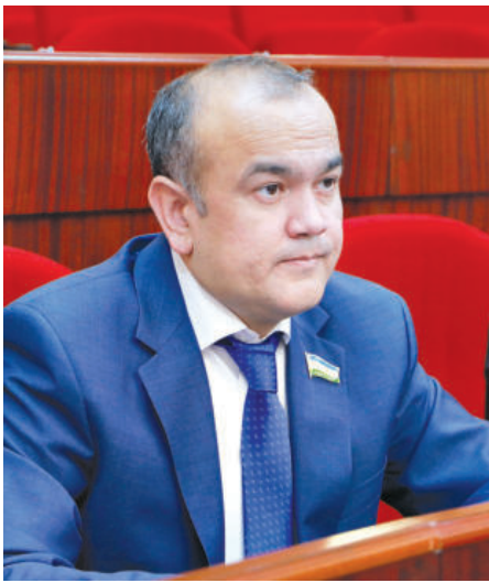
Нодир ЖУМАЕВ, Олий Мажлис Қонунчилик палатаси депутаты, иқтисод фанлари доктори, профессор

пахта даласидан топар эдик. Ишингиз битиши учун пахта даласига чиқиб, ўша ходим иш жойига олиб келинар ва яна пахта даласига олиб бориб қўйилар эди. Камига ўша ходимга пахта теришига кўмаклашишга ҳам тўғри келадиган вазиятлар бўларди. Негаки, унинг йўқотган вақти пахта нормасини бажаришига имкон бермасди-да.