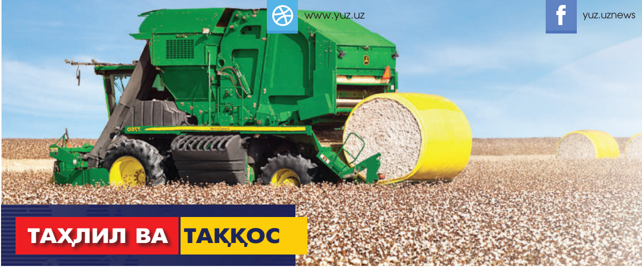
ТАҲЛИЛ ВА ТАҚҚОС

“Бугун Ўзбекистонда тараққиётнинг янги босқичи бошланди. Илм-фани ривожлантириш, замонавий билимга эга ва мустақил фикрлайдиган юқори малакали кадрлар тайёрлашга алоҳида эътибор қаратиляпти. Бунинг замирида ички ва ташқи меҳнат бозорига рақобат қила оладиган, етарли малака орқали тараққиётни таъминлашга қодир авлод вакиллари воёга етказишдек эзгу мақсад мужассам.