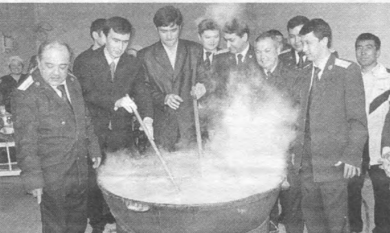
Наврўз таптаналари юртимизнинг ҳар бир гўшасига, ҳар бир меҳнат жамоасига ўзгача завқ, ўзгача шукўҳ олиб киради.

Қадим-қадимдан халқимизнинг қонига синган бир одат борки, унга бутун олам тан берган. Бу меҳр-мурувват, саховатдир. Қолаверса, 2006 йилнинг «Ҳомийлар ва шифокорлар йили» дея аталishiда ҳам ҳикмат бор. Шу муносабат билан барча маҳалла, қишлоқ фуқаро йиғинларида йиллик тадбирлар режаси ишлаб чиқилиб, хайрли ишлар аллақачон бош-