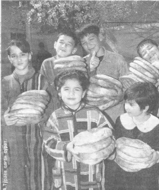
Тандир тўлаиб ёпилиди нон...