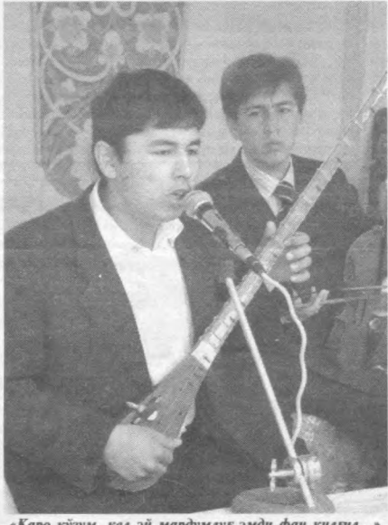
«Қаро кўзум, кел эй мардумлар эмди фан қилма...»