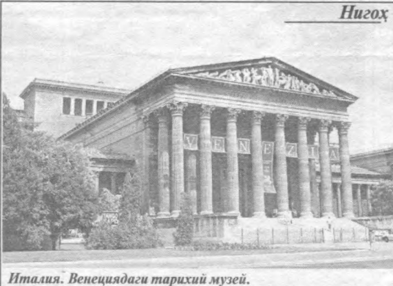
Италия. Венециядаги тарихий музей.

Францияда «Дастлабки меҳнат шартномаси тўғрисида»ги қонун кучга кириши мамлакатда катта тартибсизликларга сабаб бўлди. «France Presse» ахборот агентлигининг хабар беришича, мазкур қонунга мувофиқ иш берувчи ходимини меҳнат фаолиятининг дастлабки икки йили мобайнида ҳеч бир тушунтиришларсиз бўшатиб юборишга ва компенсация тўловини тўламасликка ҳақлидир. Шу йўл билан мамлакат ҳукумати меҳнат ресурслари бозорини янада ихчамлаштироқчи бўлган. Франциядаги талабалар ҳамда касоба уюшма ташкилотлари бир ой давомида мамлакатнинг турли бурчакларида қонуннинг қабул қилинишига қарши намоишлар ўтказган эди. Қонун қабул қилиниши билан норозилик намоишлари яна авжига чиқди. Франция президенти Жак Ширак вазиятни юмшатиш мақсадида мамлакат аҳолисига мурожаат этиб, мазкур қонуннинг айрим бандларига ўзгартириш киритишга ваъда берди.