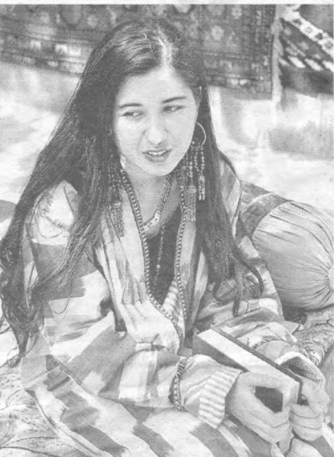
Олисларга чорлайди хаёл...

жиноят ишлари бўйича Амударё туман суди раиси».