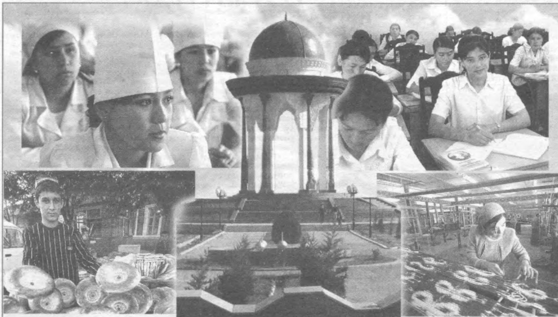
2006 йил юртимизда нафақат Ҳомийлар ва шифокорлар йили, балки тўйлар йили ҳам бўлиши кутилмоқда. Жумладан, Маъмур академиясининг 1000 йиллиги, Қарши шаҳрининг 2700 йиллиги ва Марғилоннинг 2000 йиллик юбилейларини нишонлашга катта тайёргарлик қўриляпти. Марғилон шаҳрида ҳам тўйга тўёна сифатида катта бунёдкорлик ишлари амалга оширилмоқда.

Суратда: Марғилон шаҳри ҳаётдан лавҳалар.