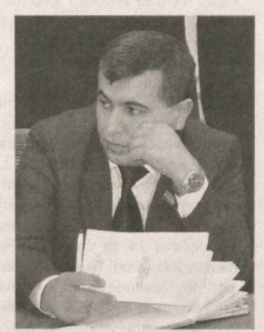
Мақсуд ҚУРБОНБОВ, Олий Мажлис Қонунчилик палатасидаги Ўзбекистон "Адолат" СДП фракцияси аъзоси:

дастурида белгиланган адолатлик гоёси, барчанинг қонун олдида тенглиги, фуқароларнинг ҳуқуқлари, эркинликлари ва қонуний манфаатларини ҳимоя қилиш "Адолат" партиясидан сайланадиган депутатлар қонунчилик фаолиятининг асосий ва бош йўналиши эканлигини таъкидлаган ҳолда Олий Мажлис Инсон ҳуқуқлари бўйича вакили (омбудсман)нинг инсон ҳуқуқларини таъминлаш юзасидан фаолиятини ижобий баҳо беришди.