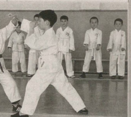
Денов ёшлари бун вақтларини ана шундай ўтказадилар.

78-мактаб жамоаси эса қулчиқар мамлакат билан самарали алоқалар ўрнатишга эришган. Шунинг учун Япониянинг мамлакатимиздаги элчихонаси вакиллари бу мактабга тез-тез таширф буюриб турадилар. Амалий ҳаракатлар бос мактаб элчихонанинг 58000 АКШ долларлик грантига сазовор