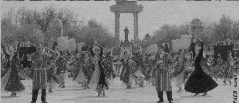
Суратда: Пойтахтимиздаги Алишер Навоий номидаги миллий бода ўтказилган Наврўз тантаналаридан лавҳалар