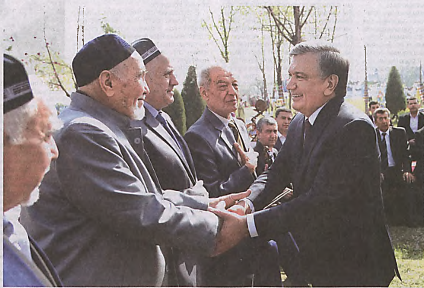
«Дорогие соотечественники, пусть каждый ваш день будет как Навруз!»

Шавкат МИРЗИЕВ, Президент Республики Узбекистан