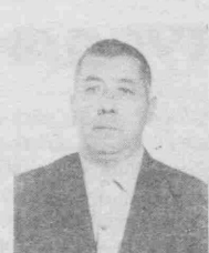
Айиб ва афвдан Собир қорни ёлми СОБИРИҲОНИ!

Онагинангни елгизсан, 10 болангни отасисан, мустақиллик шарофати ила орзуларинга етгин. Оталек гамгузор қайда, Оналек меҳрибон қайда Мангиндек жон қуяр қайда Болажоним, таваллуд айеминг муборақ!